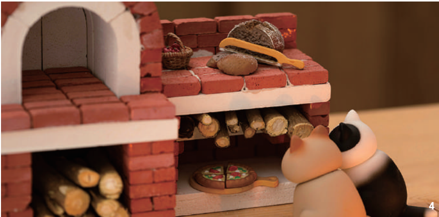
1. DIY 미니어처 오리지널 벽난로 블랙 | 2. DIY 미니어처 캠프파이어 A | 3. DIY 미니어처 뽀뽀 벽난로 4. DIY 미니어처 브라운 피자화덕 세트 | 5. DIY 미니어처 미니벽돌